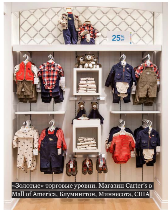
«Золотые» торговые уровни. Магазин Carter's в Mall of America, Блумингтон, Миннесота, США

Размещайте ключевые модели именно на этих уровнях. И товар будет продавать себя сам.