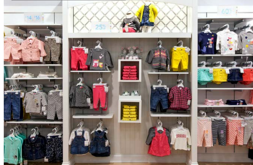
Комплектная презентация. Магазин Carter's в Mall of America, Блумингтон, Миннесота, США

презентации с фронтальной развеской, где все полукомплекты, представленные на фронтах, сочетаются между собой. Почему это правило всегда работает? Родители, приходя в детский магазин, обычно знают только категорию товара, которая нужна их ребенку. Если в вашем магазине ключевой сезонный товар будет представлен комплектами фронтально, вы сильно облегчите