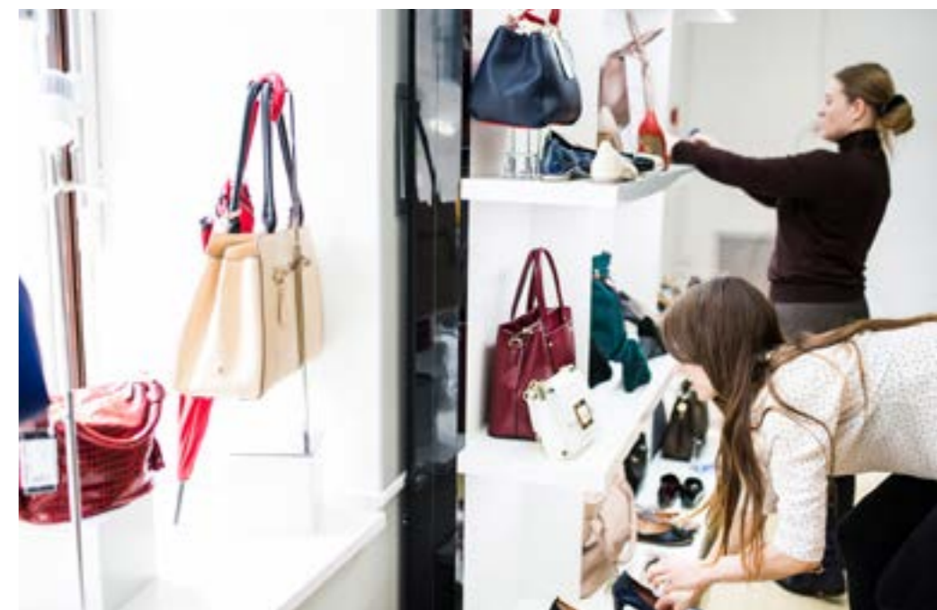
График смен презентаций определяет сам бренд, в зависимости от частоты обновления коллекций в торговом зале.

Не менее важный инструмент - управление системой визуального мерчандайзинга бренда через сезонные сетевые инструкции. Эффективность работы совершенно не предполагает наличие штатного мерчандайзера в каждом магазине. Можно отстроить систему таким образом, чтобы все торговые точки сети копировали презентации коллекций, созданные в центральном офисе для типового магазина бренда. Конечно, для этого на месте должен быть обученный сотрудник, который исполняет, к примеру, функции администратора или продавца и занимается выкладкой коллекций по презентациям-инструкциям. Именно так работают крупные сетевые обувные бренды. Важно выстроить систему обратной